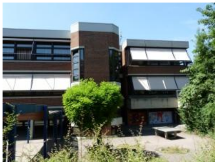
<- Das Fachgebäude