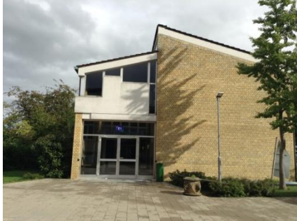
<- Das Nebengebäude