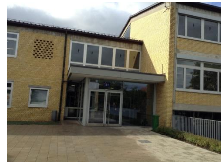
Das Hauptgebäude ->