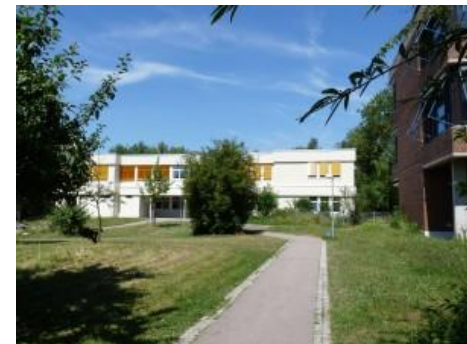
Das Erweiterungsgebäude ->